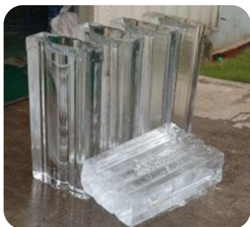
Machine de bloc de glace à petite capacité de production

Quelque soit sa dimension, Le bloc de glace est suffisamment épais pour ne pas fondre facilement. Le bloc est souvent apprêté à être coupé en morceau que ce soit pour la sculpture sur glace, le transport maritime ou encore pour la pêche. Les petits morceaux de blocs de glace peuvent être utilisés à des différentes fins. Selon vos préférences, nous vous proposons des blocs de glace de couleur transparente ou de couleur lait.